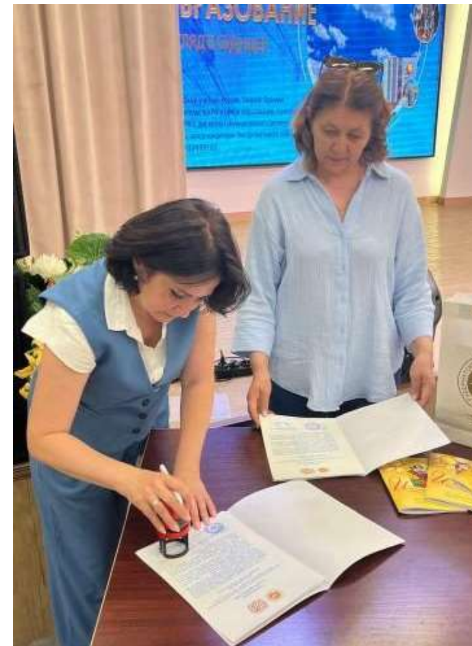
Прогимназия №64, г. Набережные Челны