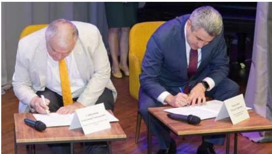
Министерство образования и науки Республики Татарстан