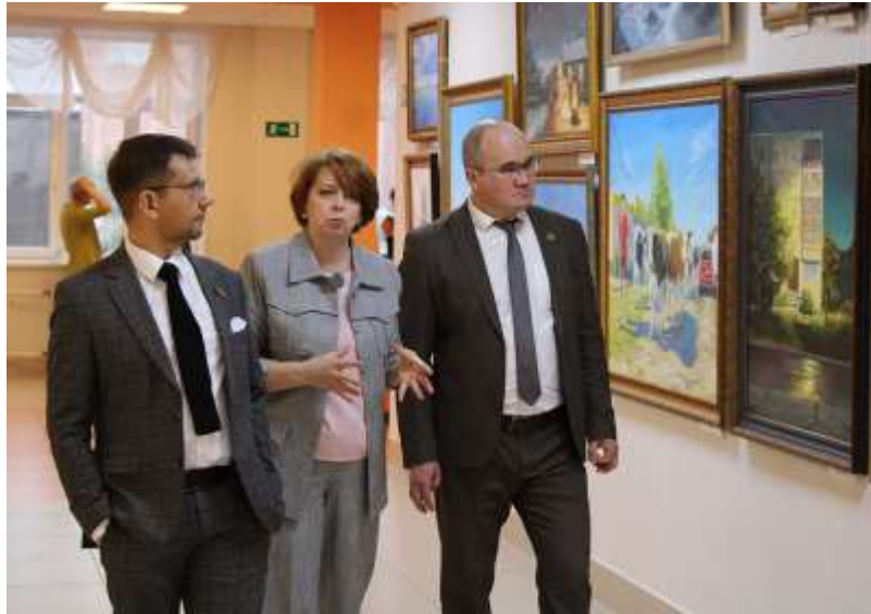
Визит руководителей ГАОУ «Полилингвальный комплекс Адымнар - путь к познанию и согласию» г. Казань