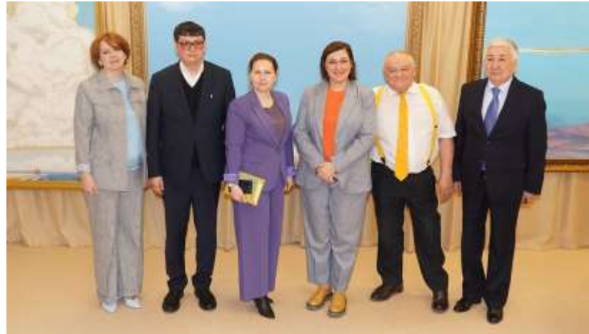
Визит делегации во главе с Чрезвычайным и Полномочным послом Республики Казахстан в РФ