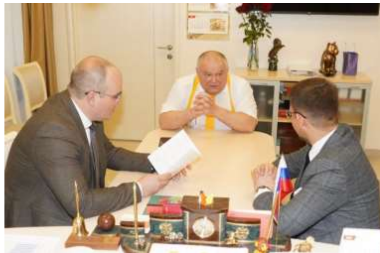
«Полилингвальный комплекс «Адымнар - путь к познанию и согласию» г. Казань