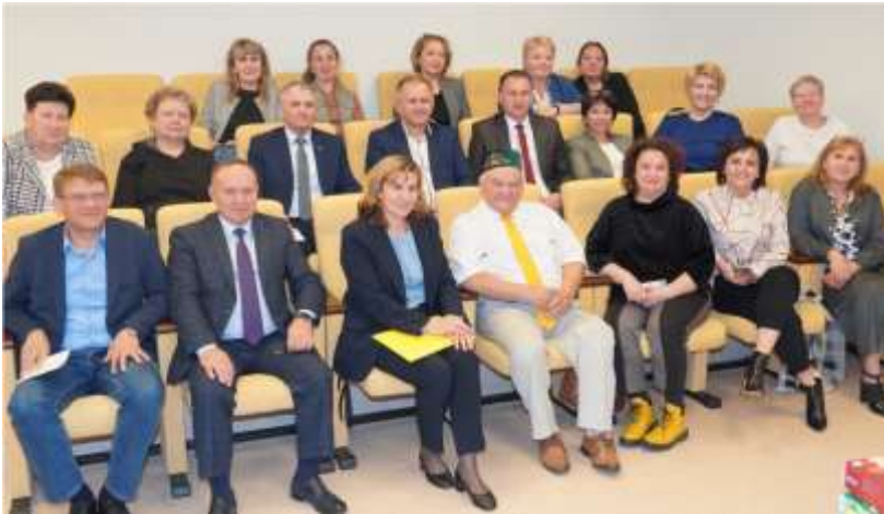
Визит делегации руководителей Управлений образованием Республики Татарстан