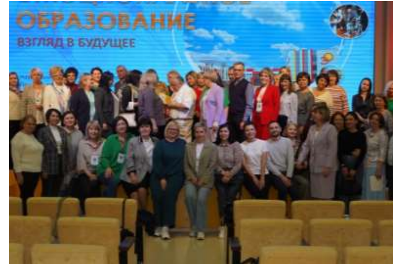
Стажировочная площадка руководителей учреждений образования г. Воронеж