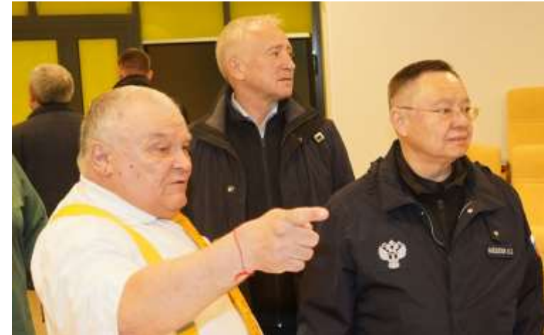
Глава Минстроя России И. Э. Файзуллин и губернатор Томской области Мазур В.В.